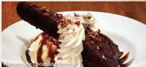
Homemade Chocolate Brownie

ホームメイドチョコレートブラウニー..... ¥750 温かい自家製ブラウニーにアイスクリーム、チョコレート、 ホイップクリーム、ピーカンナッツをトッピングして仕上げました。