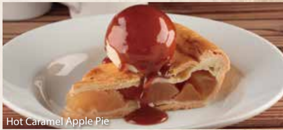
Hot Caramel Apple Pie

ホットキャラメルアップルパイ..... ¥750 ボリューム満点!温かいアップルパイの上に バニラアイスクリーム、キャラメルソースをトッピング。