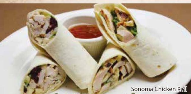
Sonoma Chicken Roll