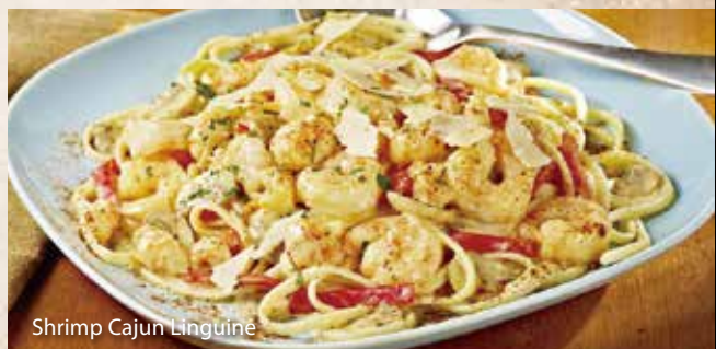
Shrimp Cajun Linguine

シュリンプ ケイジャン リングイネ。... ¥1,550 さわやかなレモンの酸味を効かせ、 スパイシーなケイジャン風味で仕上げたパスタ。 シュリンプ、パプリカ、マッシュルームの贅沢トッピング。 おろしたてのパルメザンチーズと共に召し上がり下さい。