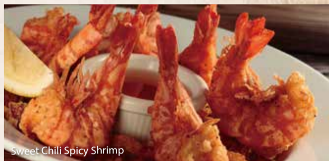
Sweet Chili Spicy Shrimp