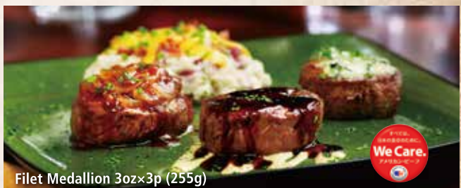
Filet Medallion 3oz x 3p (255g)

リブ アイ ステーキ..... ¥3,160 ジューシーなリブローズをお好きな焼き加減で お召し上がりください。