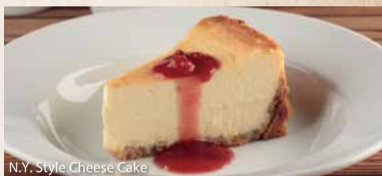
N.Y. Style Cheese Cake

ニューヨークスタイルチーズケーキ..... ¥840 クリームチーズをたっぷり使い、ストロベリーソースを トッピングしたニューヨークスタイルのチーズケーキ。