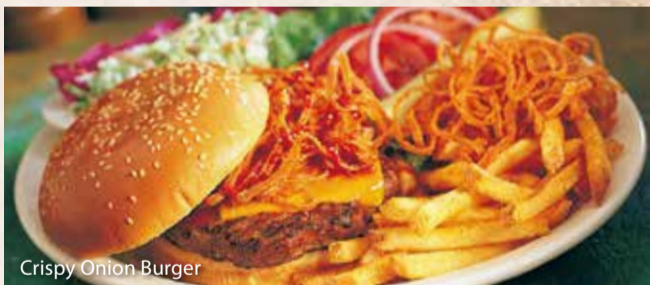
Crispy Onion Burger

ブルーチーズ バーガー..... ¥1,680 ジューシーなビーフパティに、芳醇な香りがたまらない ブルーチーズとベーコンをサンドした特製バーガー。 クリーミーな味わいとパティの旨味は相性抜群!