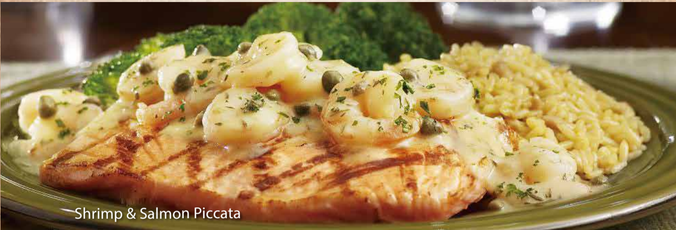
Shrimp & Salmon Piccata