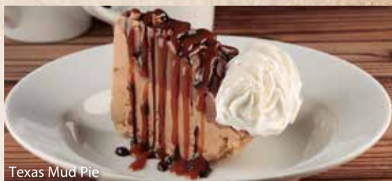
Texas Mud Pie

テキサス マッドパイ..... ¥650 香ばしいピーカンナッツクラストをたっぷり入れたモカとチョコレートのアイスクリームパイ。 ホイップクリーム、チョコレートシロップとキャラメルソース、ピーカンナッツをトッピングに加えて。