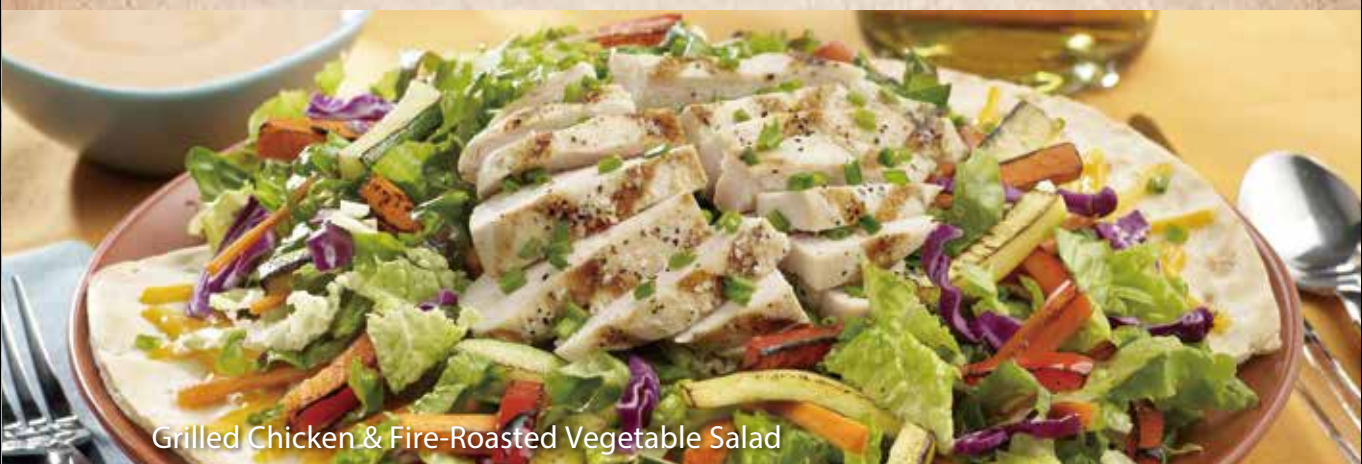
Grilled Chicken & Fire-Roasted Vegetable Salad