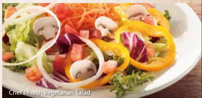
Chef's Fresh Vegetarian Salad

ドレッシングはサウザンアイランド、イタリアン、ブルーチーズ、ハニーマスタード、和風よりお選び下さい。