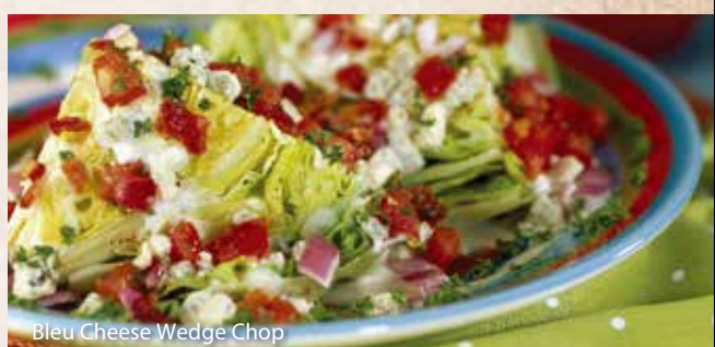
Bleu Cheese Wedge Chop

ドレッシングはサウザンアイランド、イタリアン、ブルーチーズ、ハニーマスタード、和風よりお選び下さい。