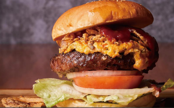
Jalapeño popper burger