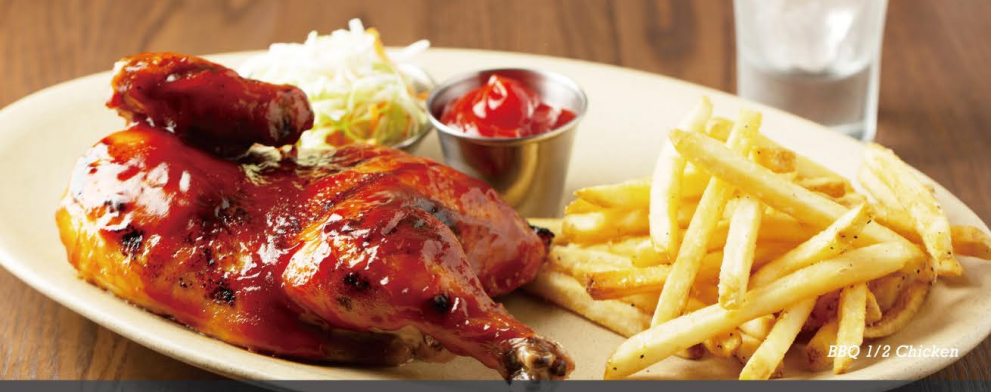
BBQ 1/2 Chicken