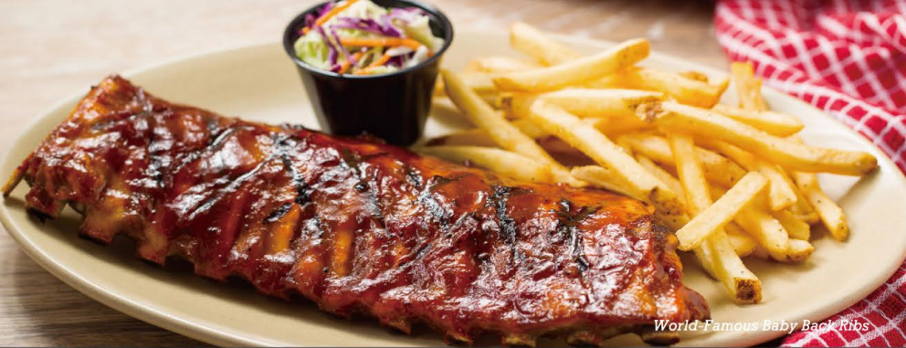
World-Famous Baby Back Ribs