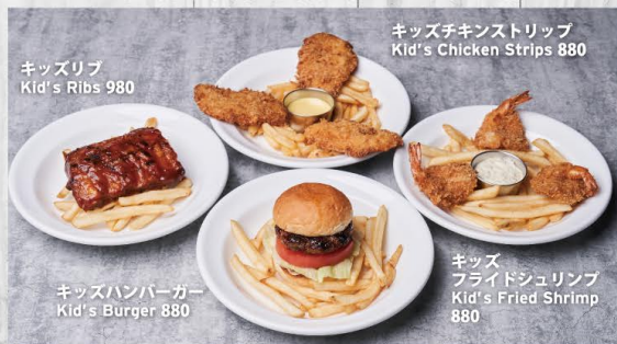
キッズリブ Kid's Ribs 980

小学生以下のお子様メニュー、フレンチフライ付き For kids 12 and under. Served with french fries.