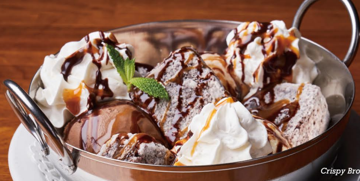
Crispy Brownie Bite Sundae