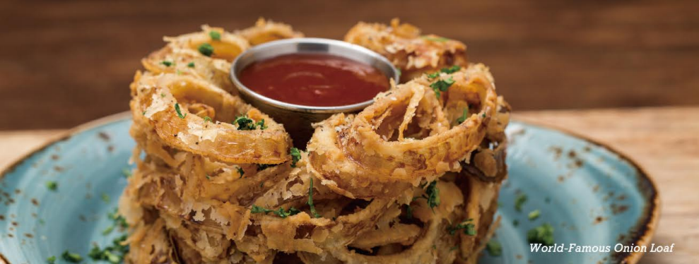
World-Famous Onion Loaf