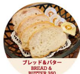
ブレッド&バター BREAD & BUTTER 350

A creamy blend of spinach, artichoke hearts and Italian cheese. Served with tortilla chips, salsa and sour cream. 1,350